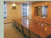
スペシャルルーム(レストラン内)