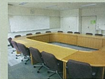
研修会議室(円卓形式1室)