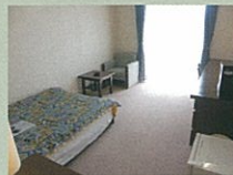
宿泊室(シングルルーム)