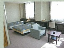
宿泊室(トリプルルーム)